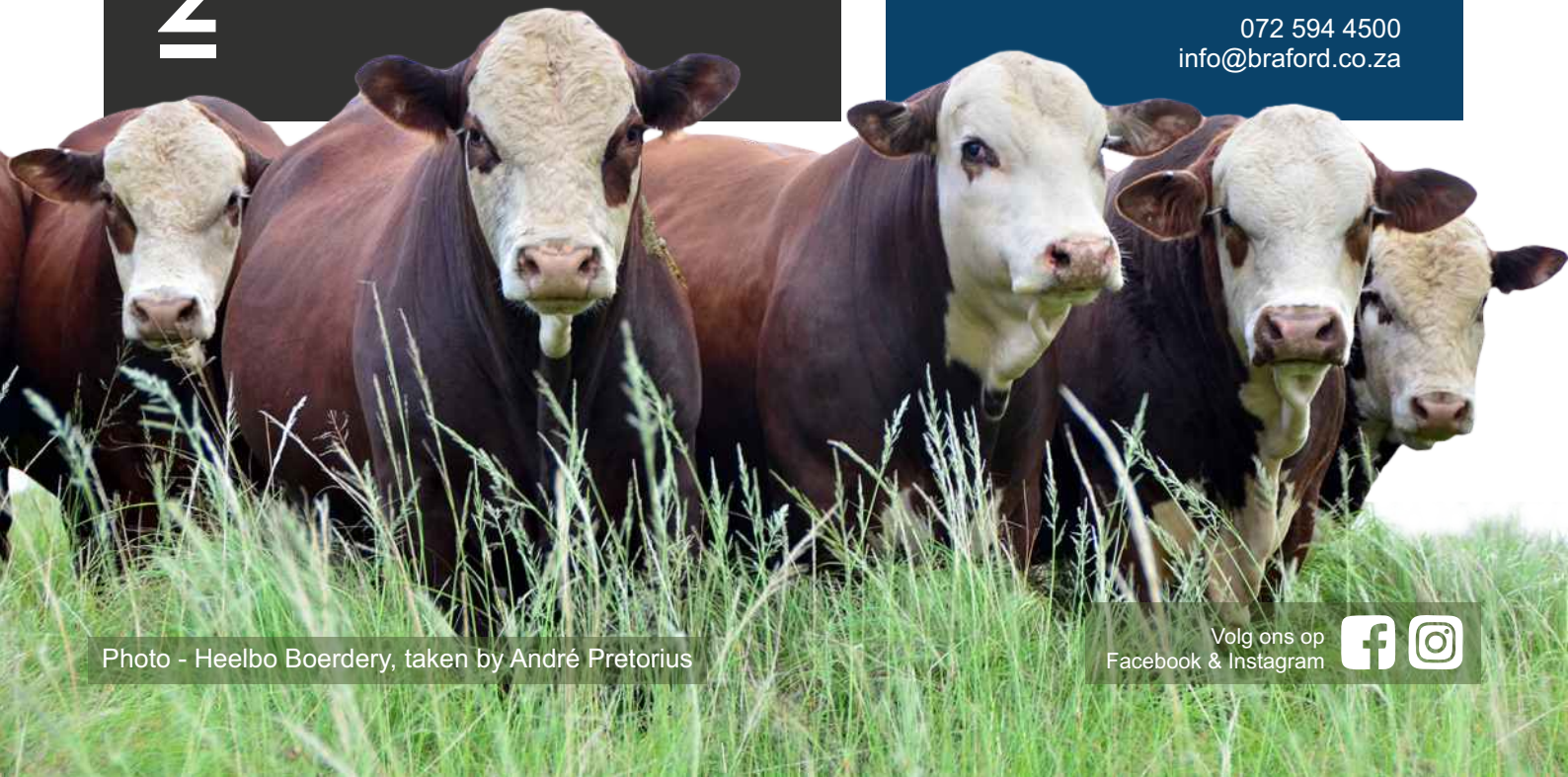
Photo - Heelbo Boerdery